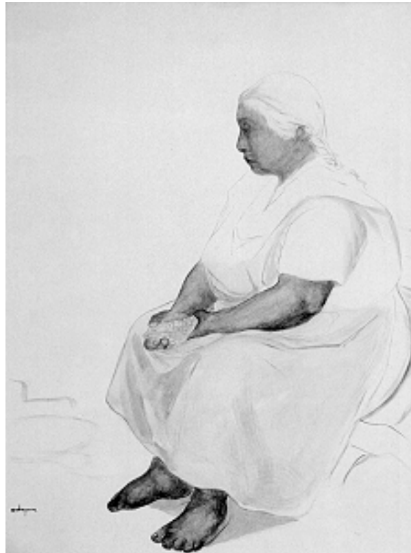
Luis Nishizawa, Doña Luz, 1946, temple sobre papel

Si usted visita una universidad de Norteamérica o Japón, son universidades extraordinarias, muy limpias, arboladas, con todo, desde luego ellos tienen todo el dinero, pero nosotros también podemos hacerlo con nuestros medios, podemos lograr un lugar apropiado para el estudiantado. Yo como soy hijo de la universidad, a mí me interesa mucho, tengo 40 años de maestro y me interesa mucho colaborar con ella.