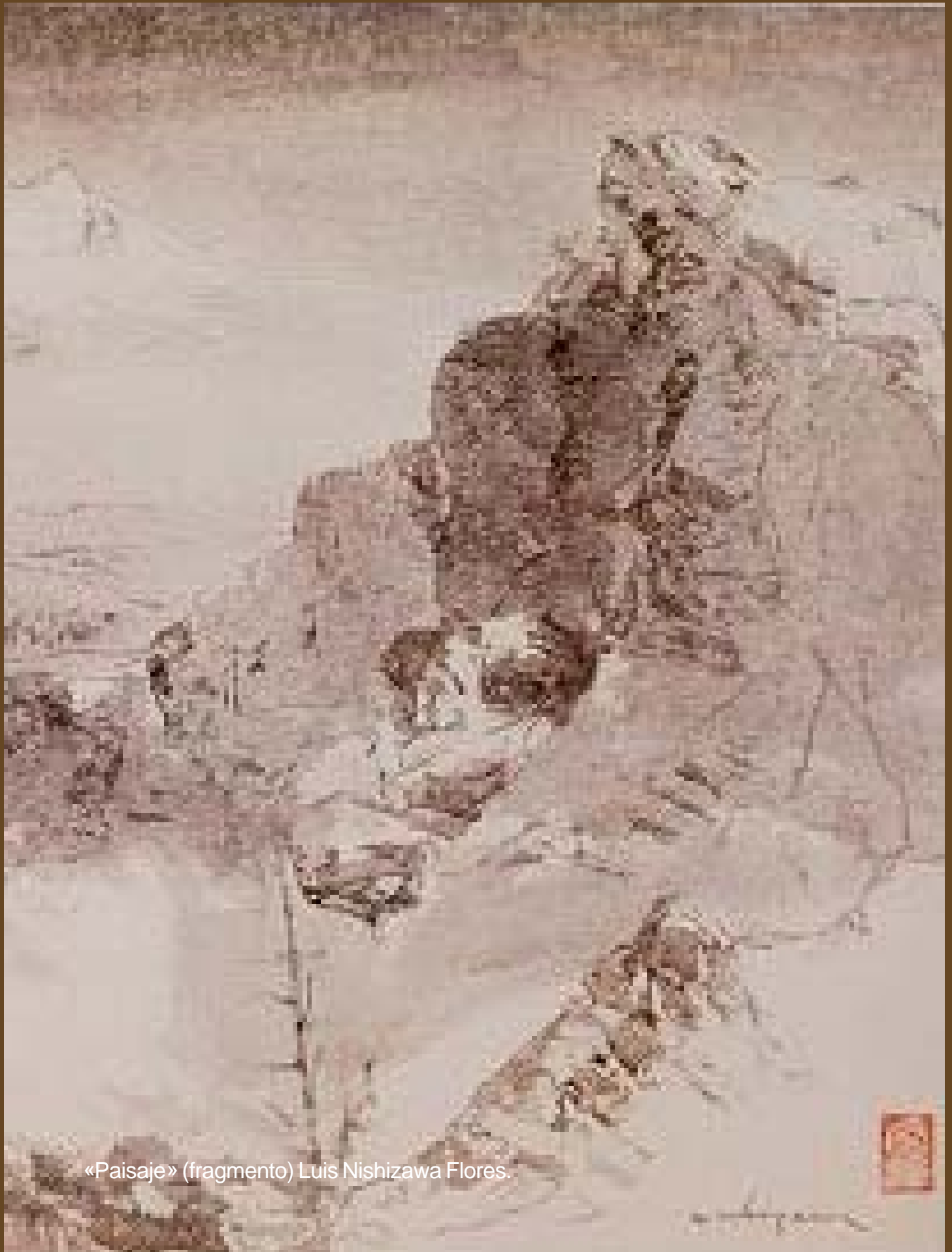
«Paisaje» (fragmento) Luis Nishizawa Flores.