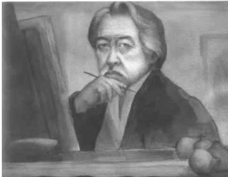
Luis Nishizawa, Autorretrato, 1988, Acuarela sobre papel

bre del polvo del medio ambiente, con eso va a ser suficiente. Si fuera pintura no sería lo mismo.