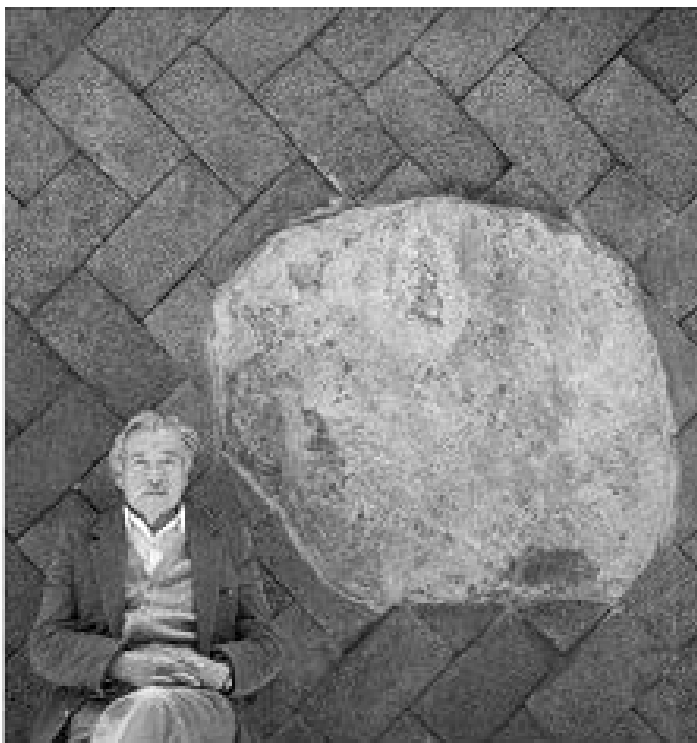
Luis Nishizawa, Helecho del universo, 1987, mural de piedra gris y oxidada

Parece que los muchachos están contentos y que ya nadie dice nada, incluso están viendo lo que estamos haciendo, y ya ve que lo que hemos hecho bajo las escaleras era un tiradero de tierra y basura, pusimos piedra de río, se limpió y quedó muy bonito todo. Lo estamos haciendo muy bien, bueno creo que muy bien.