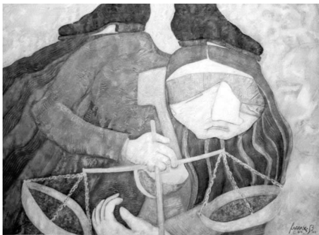
La excentricidad de la justicia, 2004. Acrílico s/papel algodón.

Julio Carrasco Bretón es muralista y pintor de caballete. Nació en México D.F en 1950. Ingeniero químico diplomado de la Universidad Nacional Autónoma de México, preparó también una maestría de filosofía. Estudió la pintura con el legendario pintor y arquitecto de la Escuela Nacional de Artes Plásticas de San Carlos, Don Lino Picaseno.