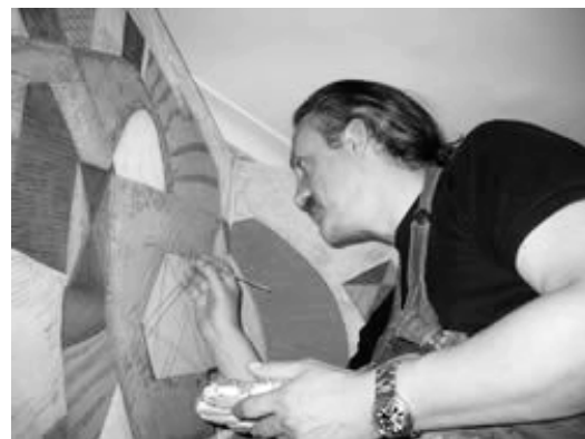
El autor en su estudio.

En sus pinturas actuales Carrasco versa sobre una búsqueda y tratamiento de nuevas morfologías absolutamente abstractas y geométricas con una gama cromática intensa y un esmerado cuidado en la