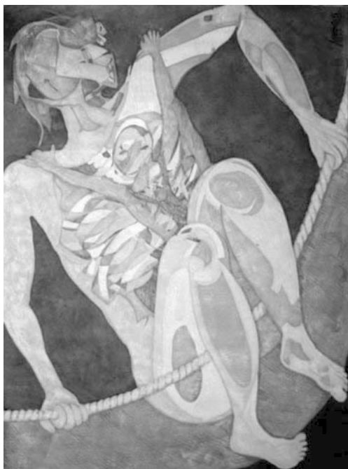
El Ogro nuestro, 2004. Acrílico s/papel algodón.

Colabora en varios periódicos y revistas culturales mexicanos como Archipielago , Excelsior , México Hoy , Quehacer político y algunos programas de radio (Radio Fórmula, Radio 620). Carrasco es también fundador de la Sociedad de Artistas Lúdicos, movimiento de carácter universal con un programa que incluye eventos ligados a lo lúdico no solo en las artes plásticas sino a todas las artes. Miembro Fundador de la Sociedad Mexicana de derechos de autor para los artistas plásticos, Somaap, asume su presidencia desde el 2001.